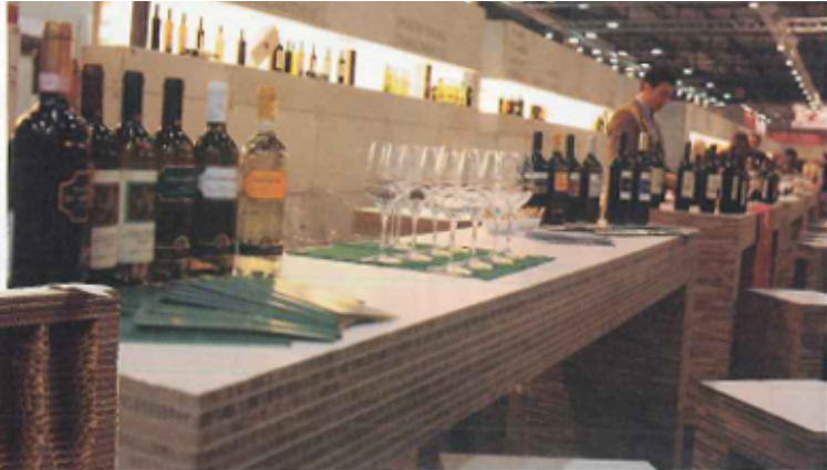
Negozi di cartone Sopra, il padiglione della Regione Umbria al Vinitaly, realizzato da Città Sottili, oggi 55100, con Oliviero Toscani e La Sterpaia. A destra, l'allestimento di un negozio Manas (azienda calzaturiera).