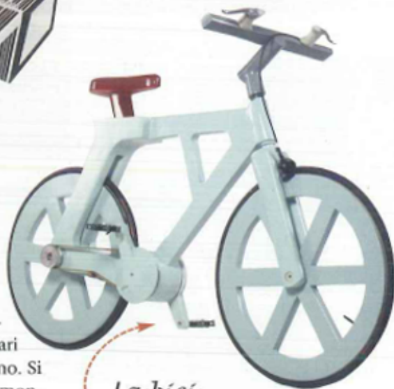
La bici in cartone riciclato

Si chiama The Alpha. L'ha ideata l'imprenditore israeliano Izhari Gafni e costa, al produttore, solo 9 dollari. Sul mercato potrebbe essere lanciata per 60-90 dollari. Porta fino a 140 kg, resiste all'umidità. «È così economica che non conviene rubarla» ha dichiarato l'inventore. Per contatti di produzione e distribuzione: www.erb.co.il/en/cooperations.asp (cliccare projects)